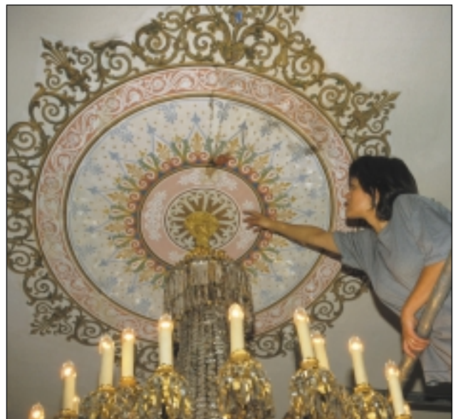
Midtrosetten i festsalens himling.

Det foregikk store oppussingsarbeider i periode 3 (1847 og/eller 1860 og/eller 1873) , da rommet fikk dekorert himling. I denne perioden var oppgraderingen av