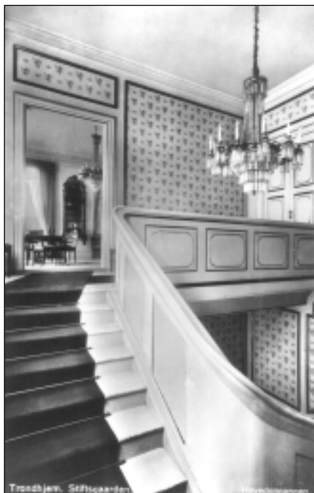
Hovedtrappen i Stiftsgården. Veggfeltene har gyllen, sjablonert dekor: den norske løve og kongekroner i sirlige rader på lys bunn. Bildet er tatt etter 1905 og før 1940.

Også periode 5 (1906) vil være uproblematisk å restaurere.