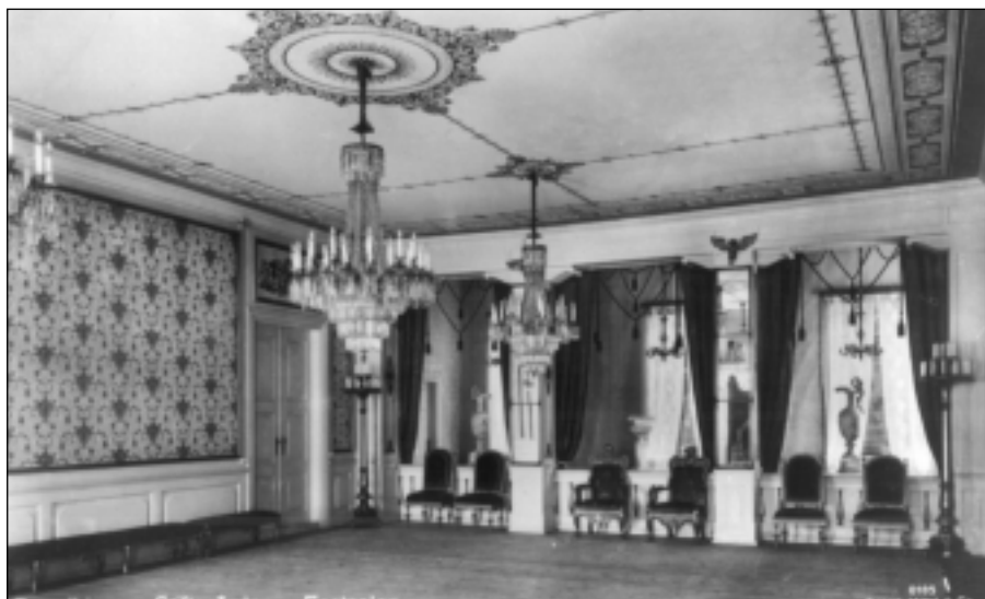
Festsalen i Stiftsgården sett mot øst med orkesterutbygget og vinduer mot bakgården. Bildet er tatt etter 1905. Malt dekor sees på pilarene ved orkesterutbygget. Videre sees papirtapetet i veggfeltene og supraportene, som ble overmalt i 1947.